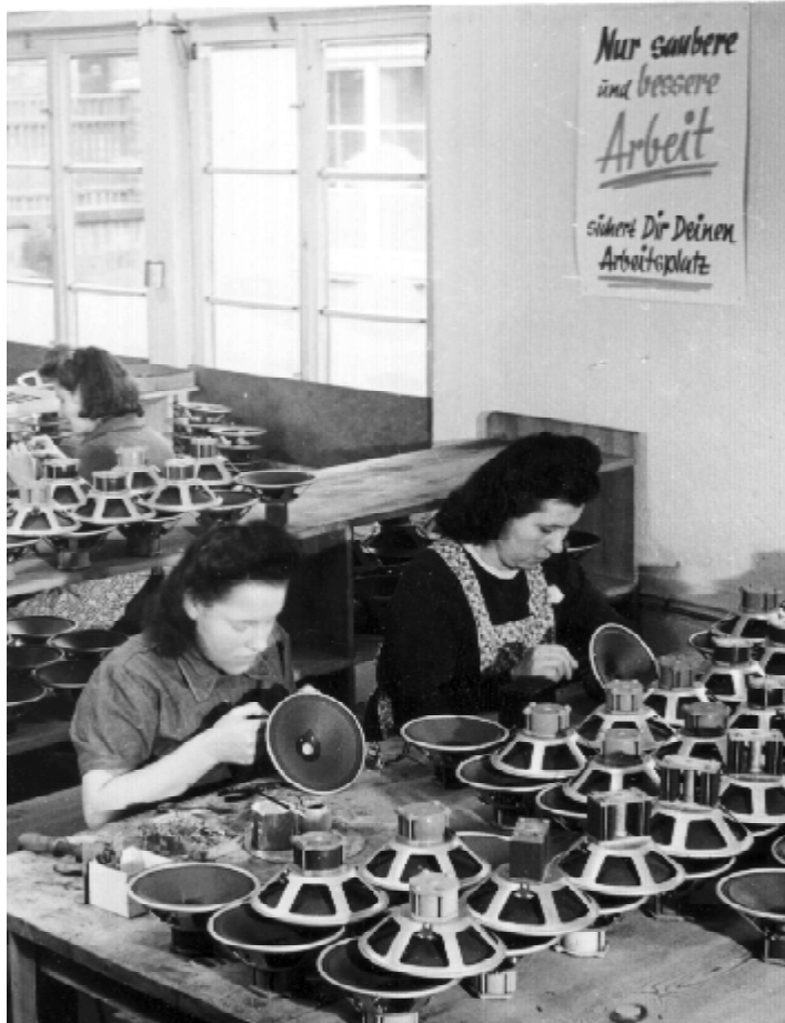
Produktion bei Grundig in der Kurgartenstraße im Jahre 1947

Max Grundig selbst fand 1981 nochmals sein persönliches Glück mit seiner dritten Ehefrau Chantal Grundig, aus der Ehe stammt sein zweite Tochter Maria - die beiden Kinder von Max Grundig wurden damit nicht weniger als 50 Jahre nacheinander geboren. Am 8. Dezember 1989 starb Max Grundig in Baden-Baden.