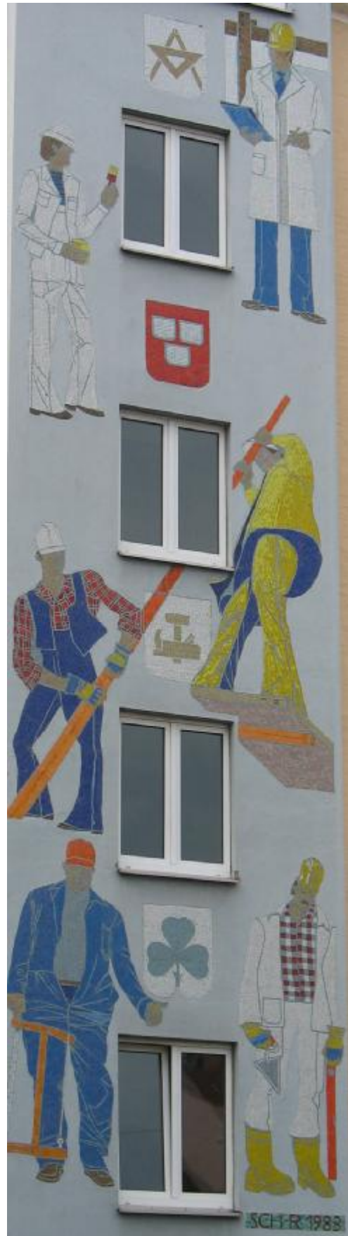
Positivbeispiel: Die Wandgestaltung von Ludwigstraße 16 wurde 1983 mustergültig erhalten und restauriert.

des Denkmalschutzes erfolgen. Deswegen müssen Häuser aus der Nachkriegszeit zumindest dann unter Denkmalschutz gestellt werden, wenn sie eine zeitgeschichtlich und/oder künstlerisch wertvolle Gestaltung aufweisen.