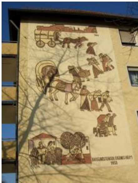
Zerstört: Sgraffito von Georg Weidenbacher und Hans Langhoyer an der Leyher Straße 79.

Zeitgeschichtlich wertvoll war dieses Sgraffito, weil es die für Fürth bedeutsame Periode des Wiederaufbaus, des sozialen Wohnungsbaus und der Flüchtlingsintegration thematisiert. Da das Gebäude nicht unter Denkmalschutz stand, konnte diese Zerstörung völlig legal und ohne Beteiligung oder Information der Baubehörde und