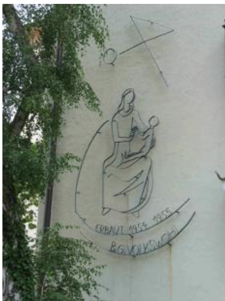
Die Baugenossenschaft Volkwohl erbaute die Laubenganghäuser Herrnstraße 44/46/48/50 vom Oktober 1954 bis April 1955. Die Fassaden sind mit Darstellungen aus Flachdraht verziert, die heute zum größten Teil durch Bewuchs völlig verdeckt sind. Im Bild: Herrnstraße 50.

des Denkmalschutzes erfolgen. Deswegen müssen Häuser aus der Nachkriegszeit zumindest dann unter Denkmalschutz gestellt werden, wenn sie eine zeitgeschichtlich und/oder künstlerisch wertvolle Gestaltung aufweisen.